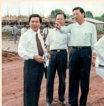
味丹越南建廠初期，時任經濟部部長江丙坤（右）蒞臨指導

公司成立之後，因初期外國投資者不多，加上當時法令與基礎條件較不完備之下，曾使公司歷經許多不同的挑戰，但憑藉決心和毅力，經營層與同仁共同戮力同心，逐一克服，於穩定中發展，也逐步站穩在越南的投資腳步。