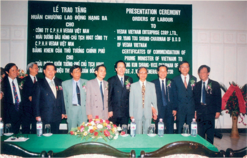
味丹越南榮獲越南國家主席授予三等勞動勳章

為了確保「Made in Viet Nam」的品質與價值，公司持續不斷提升產業的技術發展、設備技能的升級，並聘任具專業之組織團隊，以奠定現代化生產作業的基礎，朝向「健康、美味」的目標前進。