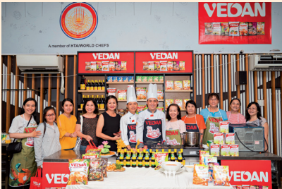
獲得越南消費者對味丹產品的相信使用