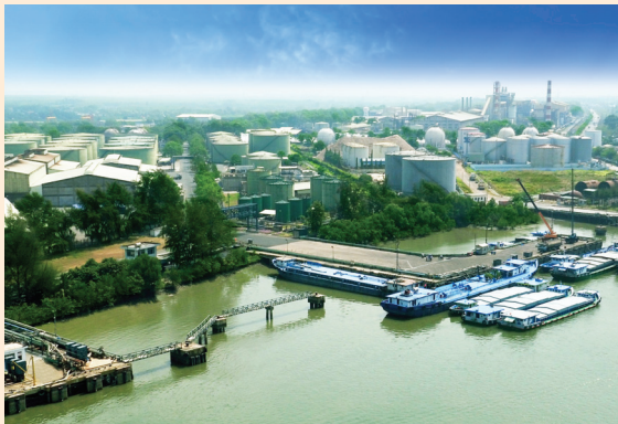
味丹越南公司的福泰港。

本著核心生物科技領域，建立一個規模面積為 120 公頃的現代化工業園區，目前擁有具規模的味精廠與各先進設備的生產廠，包括：澱粉糖漿廠、化學變性澱粉廠、