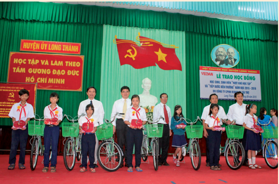
味丹越南頒發“越過困難而學習”和“接力上學”獎學金給貧困好學的學生

為了確保「Made in Viet Nam」的品質與價值，公司持續不斷提升產業的技術發展、設備技能的升級，並聘任具專業之組織團隊，以奠定現代化生產作業的基礎，朝向「健康、美味」的目標前進。