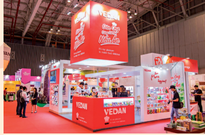
味丹越南產品展覽會