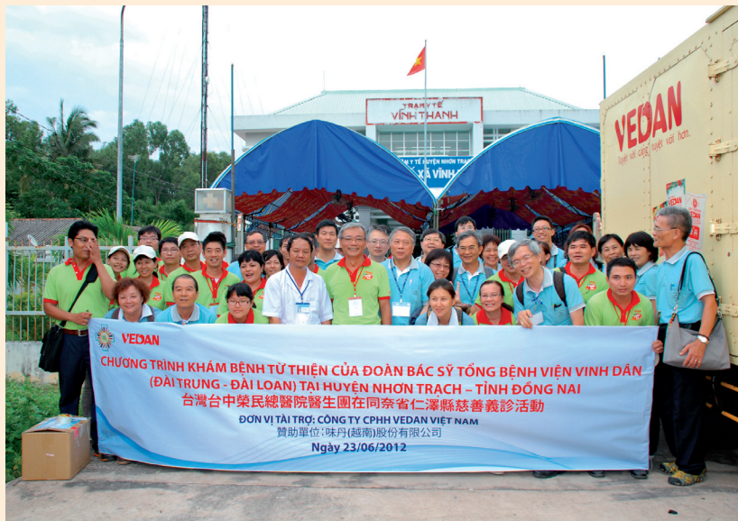
味丹越南配合台灣 - 台中榮民醫院替同奈省 9 縣義診