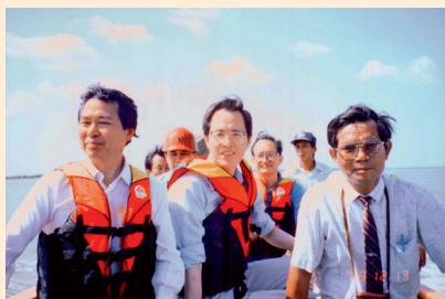
1989 年味丹台灣經營層考察氏布河及同奈河流域

於 1980 年代，因市場擴展需求與原物料供應等因素，味丹集團決定考察海外投資事業。歷經多個國家的考察，適逢越南對外開放，集團發現，越南具備與台灣類似的文化思維背景、優越便利的地理位置、