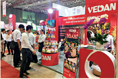
味丹越南產品展覽會