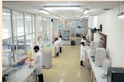
味丹越南為越南第一具有「第二級生物安全認證」實驗室的企業