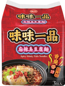
麻辣臭豆腐袋麵，全聯、GT、量販店販售

泡好後一打開就能聞到路邊小吃攤最熟悉的那種臭豆腐味道，咬了一口吸飽麻辣湯汁的臭豆腐，再配上Q彈帶勁的麵條，整個人都被美味收服！原來是味味一品新推出的麻辣臭豆腐麵，有別於一般有肉泡麵，調理包這次放的竟然是臭豆腐！打破調理包大多是肉塊的市場遊戲規則，創新加入台灣特色小吃臭豆腐，調理包不只保有許多小肉塊，更有超多塊完整厚實的臭豆腐，撕開調理包立刻臭味撲鼻，宛如街邊小吃攤端出的澎湃臭豆腐。