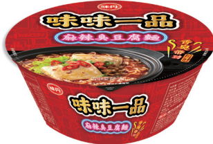
麻辣臭豆腐碗麵，四大超商、全聯、電商皆有販售